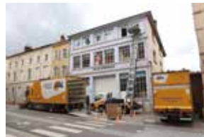
➤ Déménagement des archives le 26 mai 2025 ➤