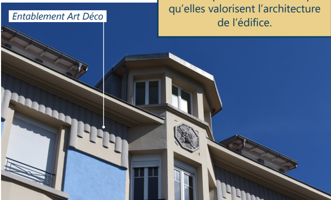
Entablement Art Déco

Traitement ornemental en creux ou en relief de certains éléments structurels, les modénatures protègent la façade du ruissellement des eaux de pluie en même temps qu'elles valorisent l'architecture de l'édifice.