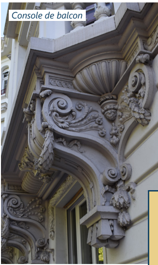
Console de balcon

Les murs sont, dans leur immense majorité, construits en moellons de grès enduits.