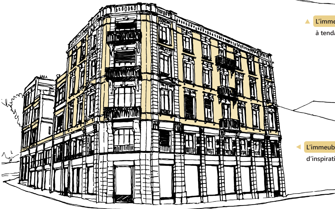
◀ L'immeuble bourgeois d'inspiration néoclassique