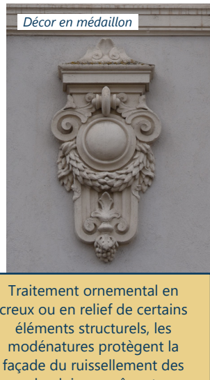
Décor en médaillon

Traitement ornemental en creux ou en relief de certains éléments structurels, les modénatures protègent la façade du ruissellement des eaux de pluie en même temps qu'elles valorisent l'architecture de l'édifice.