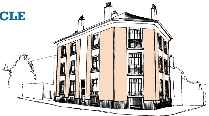
▲ L'immeuble des années 1920 à tendance Art déco