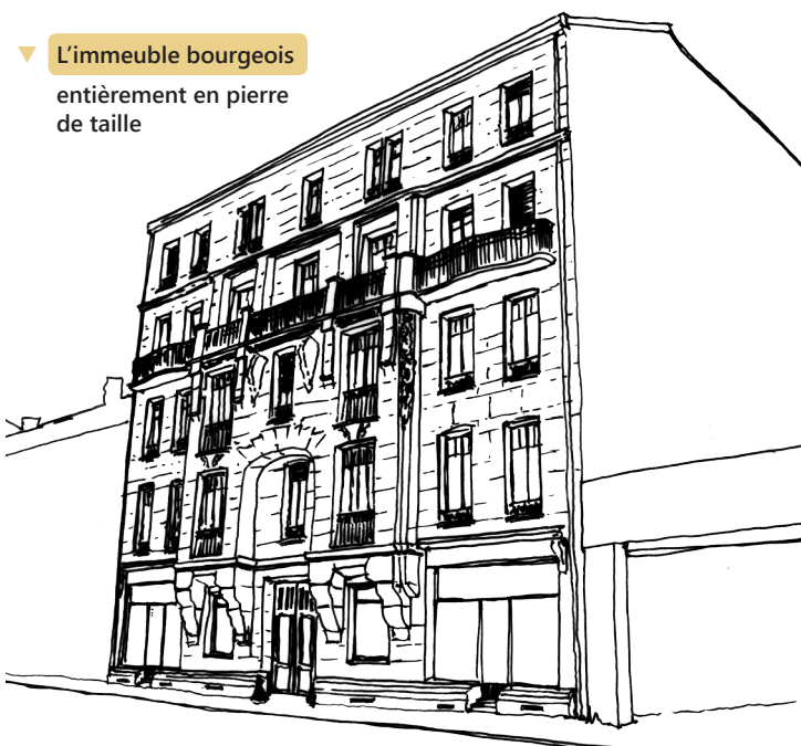
▼ L'immeuble bourgeois entièrement en pierre de taille