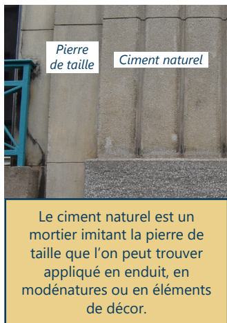
Pierre de taille

Allège mêlant briques de terre cuite et de laitier