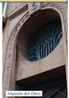
Imposte Art Déco