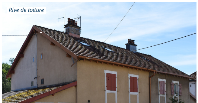
Rive de toiture