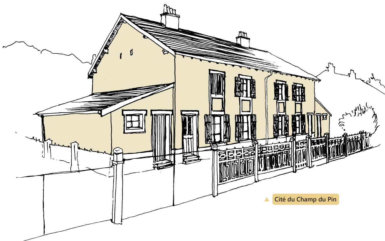
▲ Cité du Champ du Pin