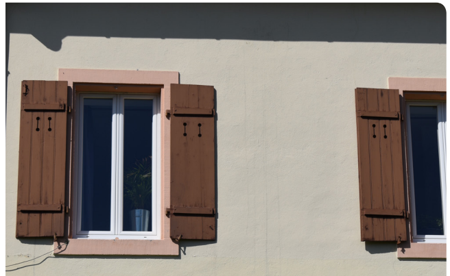
Ouverts, fermés, entrebâillés, les volets animent les façades et les rues par leur relief et leur couleur.