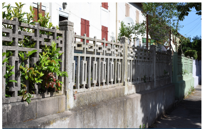
Les clôtures en béton, dont le portillon en acier reprend ici le dessin dans la cité du Champ du Pin, participent à l'unité de la cité.