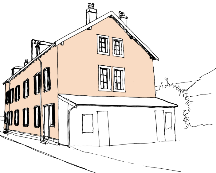
Cité du Champbeauvert ▶