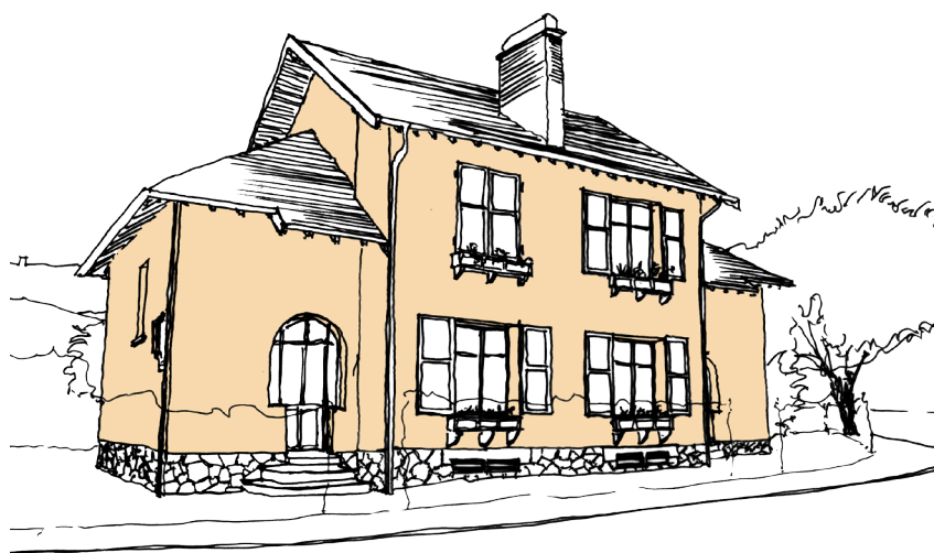
▲ Cité rue Viviani

Au lendemain de la guerre de 1870, Epinal connaît un fort développement industriel. Jusque dans les années 1930, les patrons d'usines construisent eux-mêmes des logements pour une partie de leurs employés. Certaines cités spinaliennes sont l'œuvre des compagnies de chemin de fer.