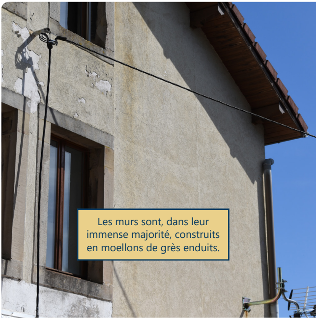
Les murs sont, dans leur immense majorité, construits en moellons de grès enduits.