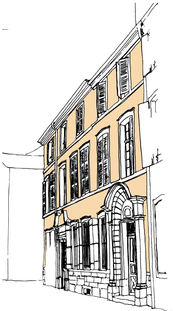
L'immeuble urbain XVII-XVIII e siècle ▲ (ici une maison de Chanoinesse)