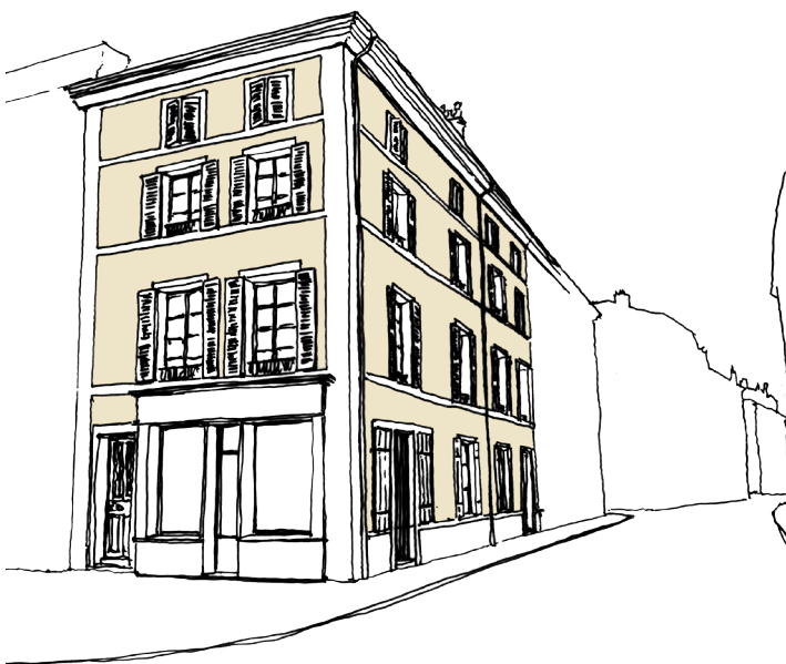
▲ L'immeuble du début du XIX e siècle

Au XVIII e siècle, époque marquée par un véritable essor économique et commercial, la ville ancienne a été largement transformée notamment lors du démantèlement de ses remparts. Elle se développe alors au-delà de son centre historique le long de ses faubourgs, puis à partir du XIX e siècle dans de nouveaux quartiers.