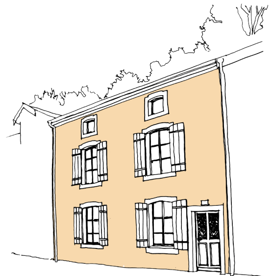
La maison ou l'immeuble mitoyen(ne) ▲