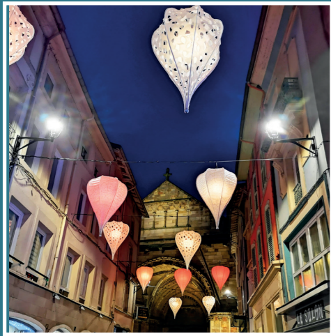
«Amours en cages» par Porté par le vent