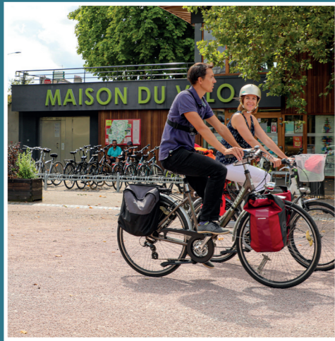
Maison du vélo au port d'Épinal