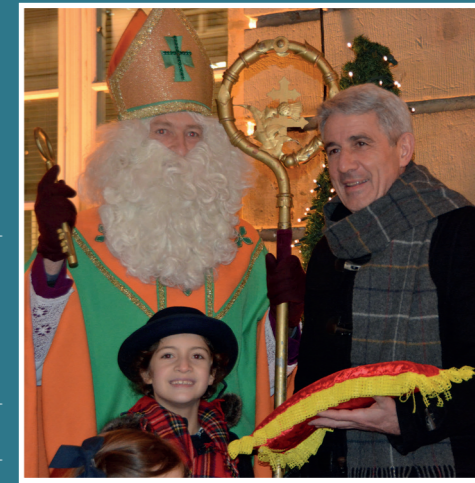
Remise des clés par le Saint-Nicolas à Monsieur le Maire