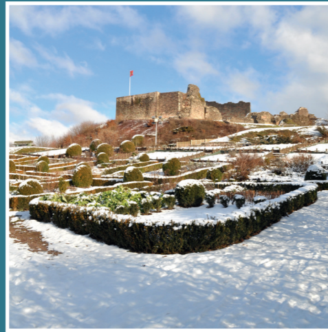
Château d'Épinal sous la neige