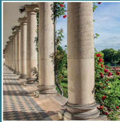
Maison Romaine en bord de Moselle