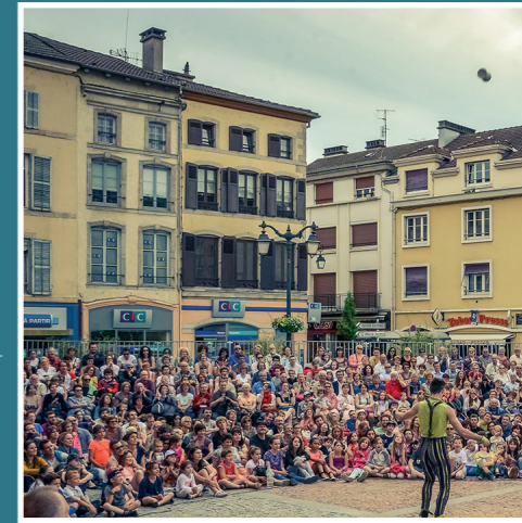
Place des Vosges - festival «Rue & Cies»