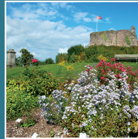
Jardin du château d'Épinal en été