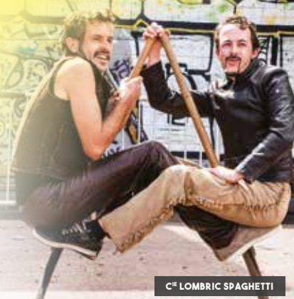
C E LOMBRIC SPAGHETTI